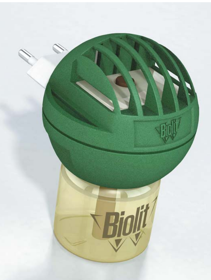
Doma nebo v práci pomohou proti hmyzu elektrické odpařovače Biolit.

prašovačem. U této varianty pro nejmenší děti se doporučuje, aby si rodič nebo jiný dospělý nejprve nastříkal přípravek na ruce a poté rozetřel na pokožku děťátka. Ta minuta navíc se rozhodně vyplatí, abyste nemuseli řešit složité odstranění klíštěte a obávat se vážných zdravotních komplikací.