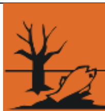
Nebezpečný pre životné prostredie